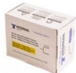
AGRAFES POUR P68 - 1/4" - 5 000/bte STCR501938