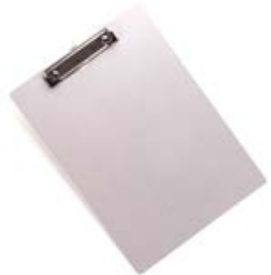
PLANCHE AVEC PINCE - aluminium - 8" x 11" PLANCHA811