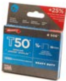
AGRAFES POUR GT50 - 3/8" - 1 250/bte T5038