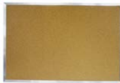
TABLEAU EN LIÈGE