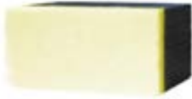
BROSSE - pour crayon non-permanent - 5" BROSSEMAGI