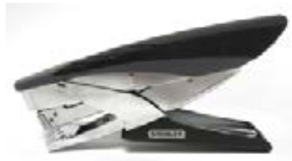
AGRAFEUSE agrafeuse RP3 agrafes 1/4" (5 000/bte) SBS19