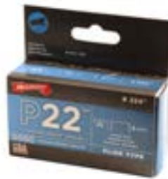
AGRAFES POUR P22 - 1/4" - 5 050/bte P2214