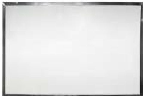
TABLEAU BLANC MAGNÉTIQUE