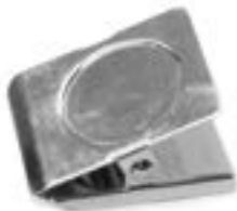
PINCE CARRÉE AIMANTÉE - 1 3/4" x 2" - 3/paquet PCAIMANT