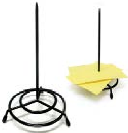
PIC POUR FACTURES PIC