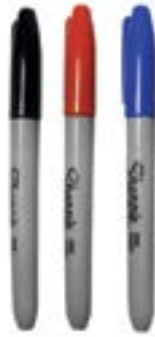
CRAYON FEUTRE PERMANENT - Sharpie - pointe régulière noir SHARPN rouge SHARPR bleu SHARPB