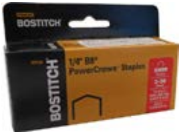
AGRAFES POUR B8P - 1/4" - 5 000/bte 211514