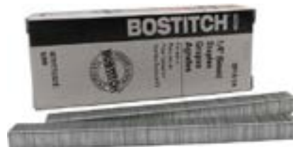
AGRAFES POUR P3 - 1/4" - 5 000/bte SP1914