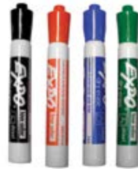
CRAYON FEUTRE NON-PERMANENT - Expo - pointe moyenne - effaçable à sec noir EXPO2N rouge EXPO2R bleu EXPO2B vert EXPO2V