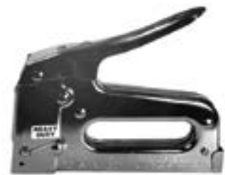
AGRAFEUSE - pour gros travaux agrafeuse GT50 agrafes 3/8" (1 250/bte) T5038