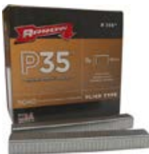
AGRAFES POUR P35 - 3/8" - 5 040/bte P3538