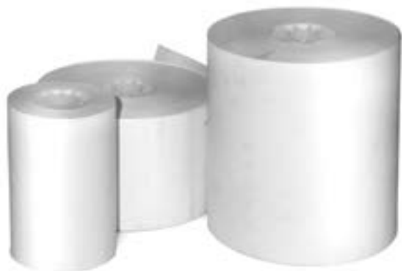
ROULEAU DE PAPIER POUR CAISSE ENREGISTREUSE ET TERMINAL INTERAC