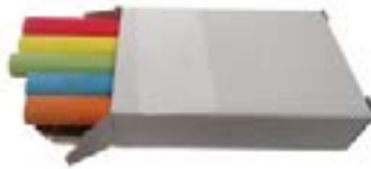
CRAIES DE COULEURS - 10/paquet couleurs assorties CRAIEC blanc CRAIEB jaune CRAIEJ