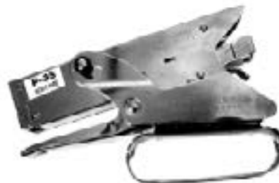
AGRAFEUSE agrafeuse P35 agrafes 3/8" (5 040/bte) P3538