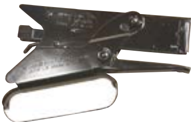
AGRAFEUSE - broches fines agrafeuse P22 agrafes 1/4" (5 050/bte) P2214 5/16" (5 050/bte) P22516