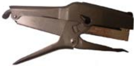
AGRAFEUSE agrafeuse B8P agrafes 1/4" (5 000/bte) 211514 3/8" (5 000/bte) 211538