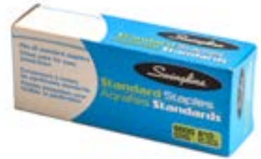
AGRAFES POUR RP3 ET RAPIDA1 - 1/4" - 5 000/bte SBS19