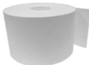
ROULEAU DE PAPIER POUR CAISSE