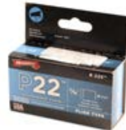
AGRAFES POUR P22 - 5/16" - 5 050/bte P22516