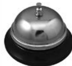
SONNETTE DE COMPTOIR