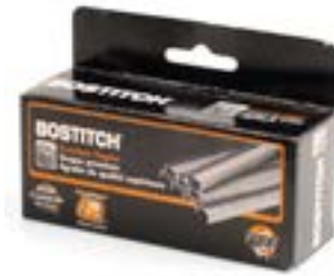
AGRAFES POUR B8P - 3/8" - 5 000/bte 211538