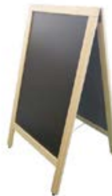
TABLEAU SUR CHEVALET