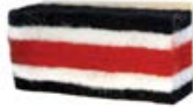
BROSSE - pour tableau noir - 5" BROSSE